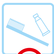
アメニティ交換 change amenities