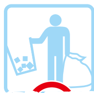
ゴミ箱・灰皿清掃 clean the trashcan and ashtray