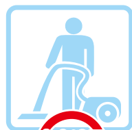
室内清掃 clean the room