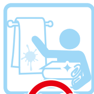
タオル交換 change towels