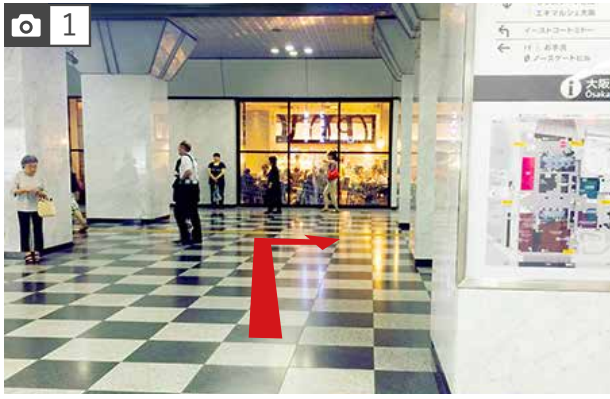
JR大阪駅【御堂筋口改札】を出て、直ぐに右折し、【御堂筋南口】の方へ出ます