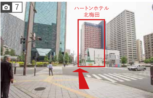
7 直進後にある横断歩道を、そのまま渡ってください。横断歩道を渡って直ぐにある、ピンク色の建物が当ホテルです。