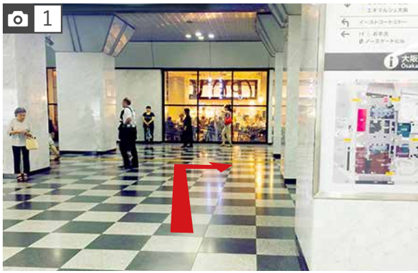
JR大阪駅【御堂筋口改札】を出て、直ぐに右折し、【御堂筋南口】の方へ出ます