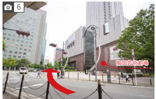
6 梅田芸術劇場前の三叉路に着いたら、右側の道に直進してください