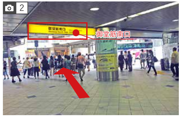
外に出て左手にある横断歩道を渡ってください