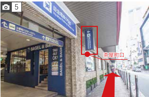
5 しばらく直進すると、阪急茶屋町口があります