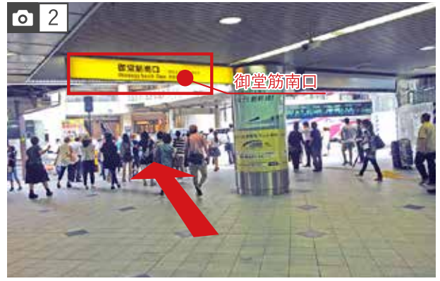
2 外に出て左手にある横断歩道を渡ってください