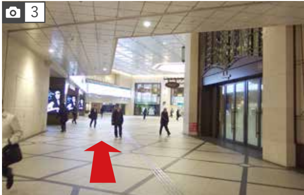
目の前の建物に入り、阪急百貨店を右手に構内の外に出てください