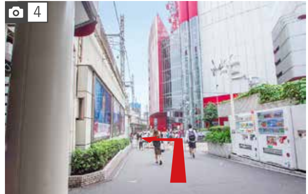
HEP5(屋上に赤い観覧車有)の手前を左、高架下をくぐり直進してください