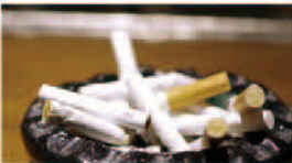
タバコ臭(有機化合物)