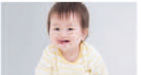
赤ちゃん・小さなお子様