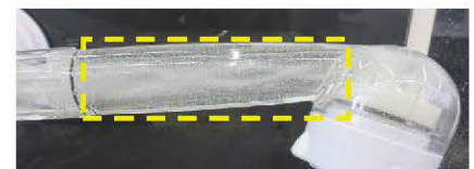
【トルネード水流可視化画像】

※計測:サイエンス調べ(マイクロトラックベル社ZETA VIEW使用) ※水質により数値は変動します。