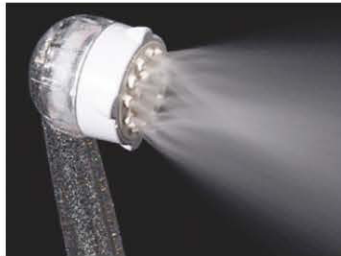
【ウルトラファインバブルミスト水流】 やさしく包み込むミスト水流

ミラブルプラスはウルトラファインバブルを含むミスト水流とマイクロバブルを含んだストレート水流をお好みのポジションでご使用いただけます。