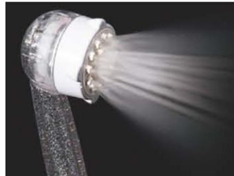
【ウルトラファインバブルミスト +マイクロバブルストレート水流】 無段階切り替えで両方の水流を同時に 使うことも可能