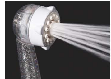
【マイクロバブルストレート水流】 ダイレクトに感じるストレート水流