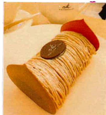
◀ムッシュ・モンブラン 1,296円(税込) ※ テイクアウト可。