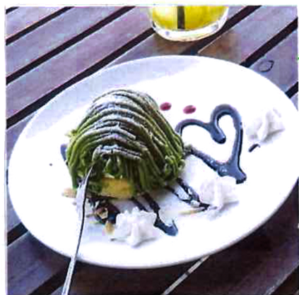
モンブラン・苺・抹茶の3種類 750円(税込)