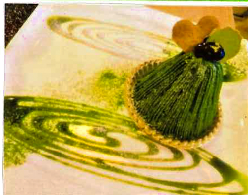
濃茶モンブラン ・単品 715円(税込) ・ドリンクセット 1,100円(税込)