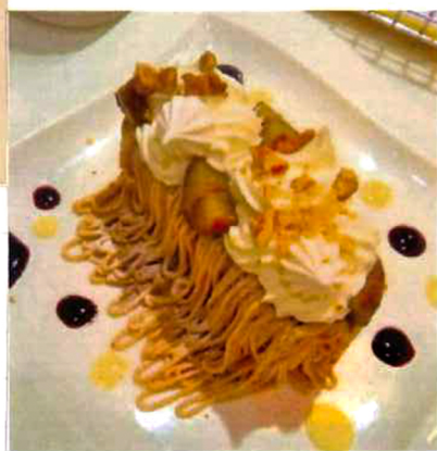
■ 絞ったモンブラン → 1,210円(税込) ※ JR京都伊勢丹 サロン限定商品