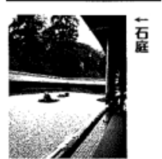
↑石庭 方丈(本堂)補修屋根の葺き替え工事 ※平成22年2月25日まで ●拝観料金 500円