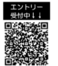
エントリー受付中!!