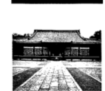
↑金堂(国宝) ●拝観時間 9:00~16:30まで ●拝観料金 500円